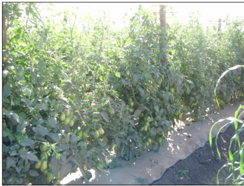
Blue 76+ Blue Life