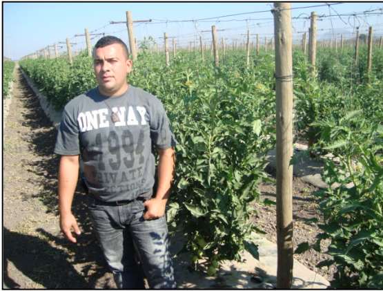
Blue 76+ Blue Life

Se observa mayor desarrollo en la planta tratada con Blue Life + Blue 76, más porte más racimos de tomate, menor numero de enfermedades que en la tabla testigo: