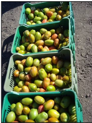
Blue 76+ Blue Life