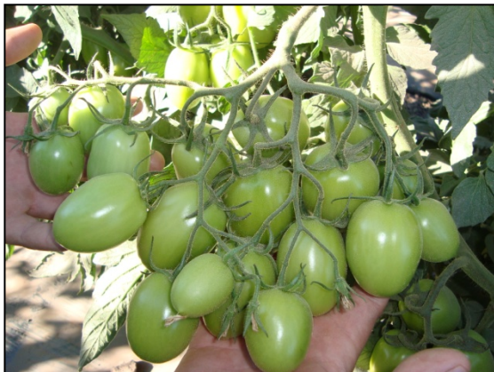
Blue 76+ Blue Life

En la parte tratada se observan racimos completos de 24 tomates, en la parte del testigo se observan los racimos tradicionales: