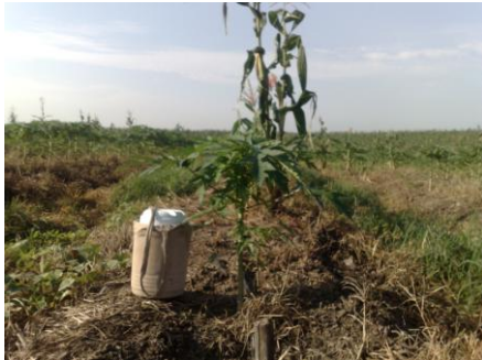
DESARROLLO 15 DÍAS POSTERIORES