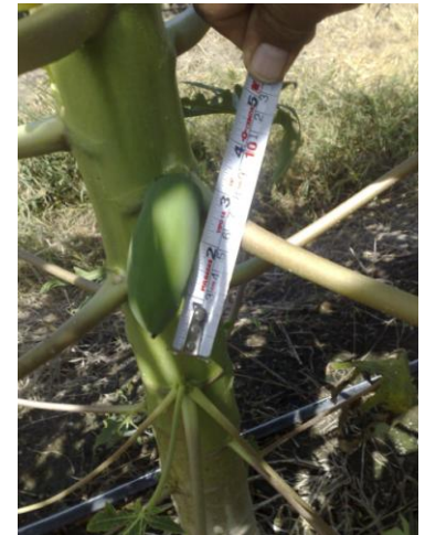
DESARROLLO POSTERIOR A 4 APLICACIONES